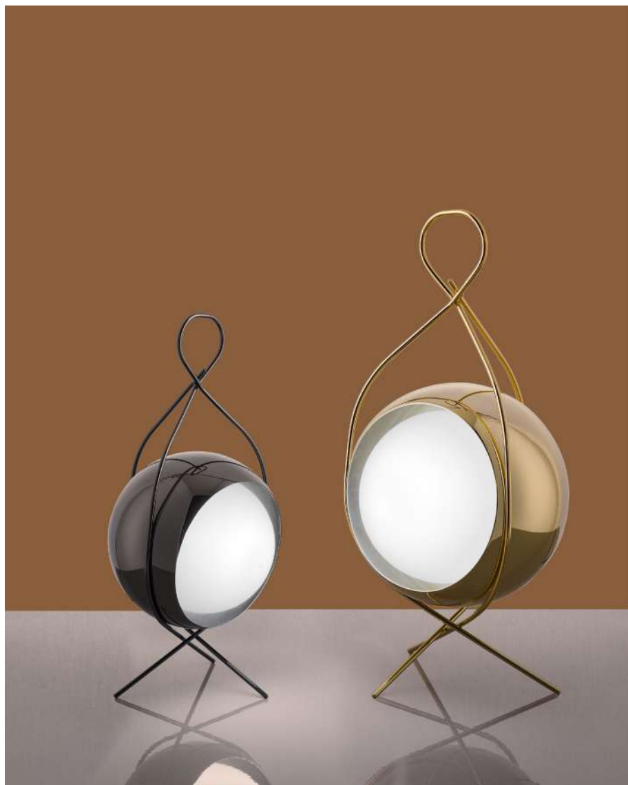
Nobody lamp small | big